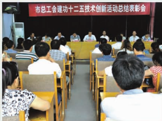
市总工会建功十二五技术创新活动总结表 彰会