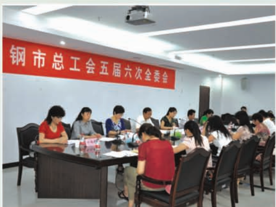
市总工会五届六次全委会