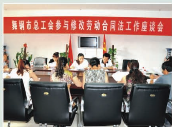
市总工会召开参与修改《劳动合同法》 工作座谈会