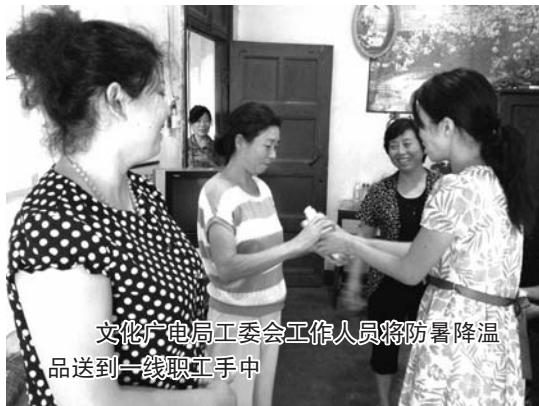
文化广电局工委工作人员将防暑降温品送到一线职工手中

7月30日上午，骄阳似火，室外气温高达36℃。实业公司党政工团一行深入20家基层