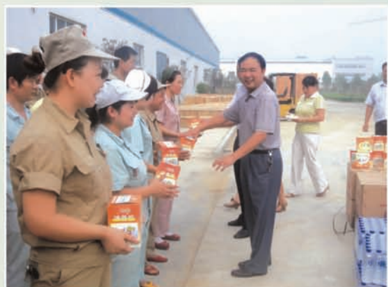
市总工会主席陈云洲在鑫海纺织慰问一 线工人