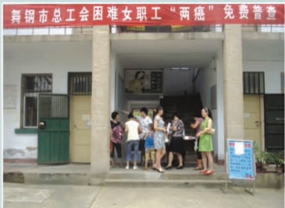
市总工会为困难女职工进行“两癌”免费普查