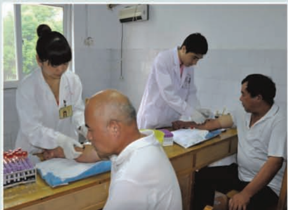
市总工会组织困难职工免费体检