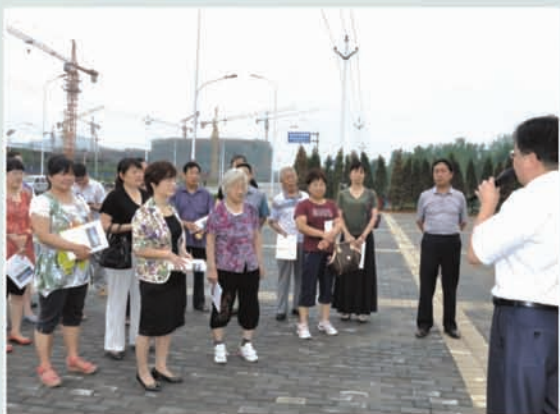
市总工会庆“七一”全体党员参观产业集聚区