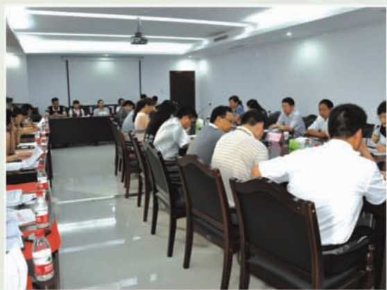
市总工会召开依法普遍建立工会组织工 作推进会