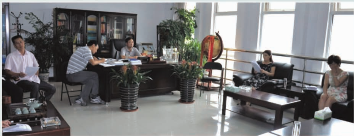
市总工会全体干部职工学习“新九论”